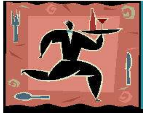
Eet- & praatcafé De Wijngaard