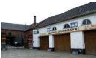
Brouwerij Van Den Bossche Sint-Lievens-Esse

Voor detail van de verschillende afstanden surf naar www.wijngaardvrienden .be