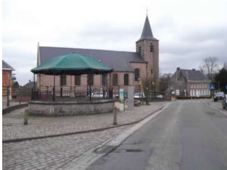
Bevoorradingplaats Sint Lievens Esse

Voor detail van de verschillende afstanden surf naar www.wijngaardvrienden .be