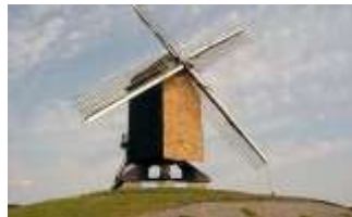
Molen Ter Rullegem Herzele