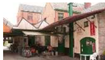
Brouwerij De Ryck Herzele